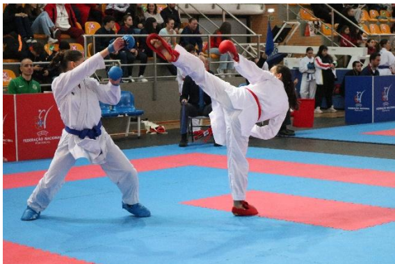
(Kumite Cadete Feminino)