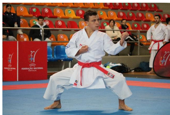
(Kata Sénior Masculino)