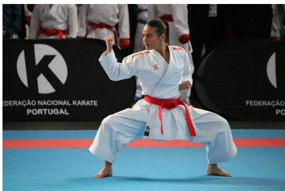
(Kata Sénior Feminino)

A prova decorreu em cinco áreas de competição durante aproximadamente nove horas e meia no sábado e sete horas e meia no domingo, sem atrasos relativamente ao previsto.