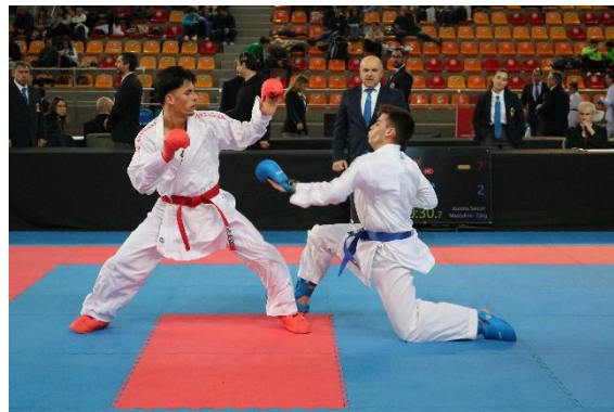
(Kumite Sénior Masculino)